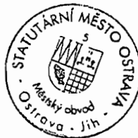
Bc. Martin Bednář starosta Městského obvodu Ostrava-Jih